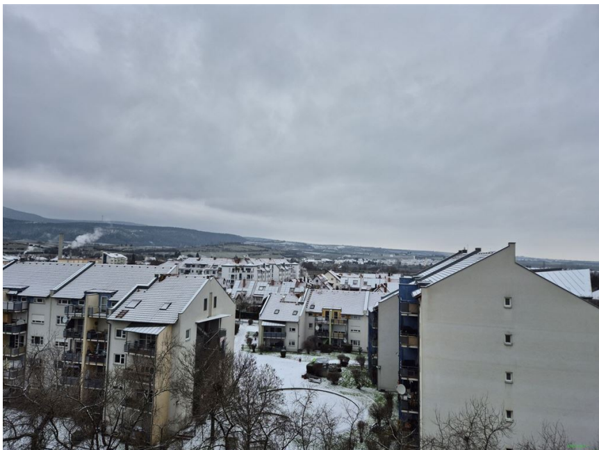
Blick nach Nord