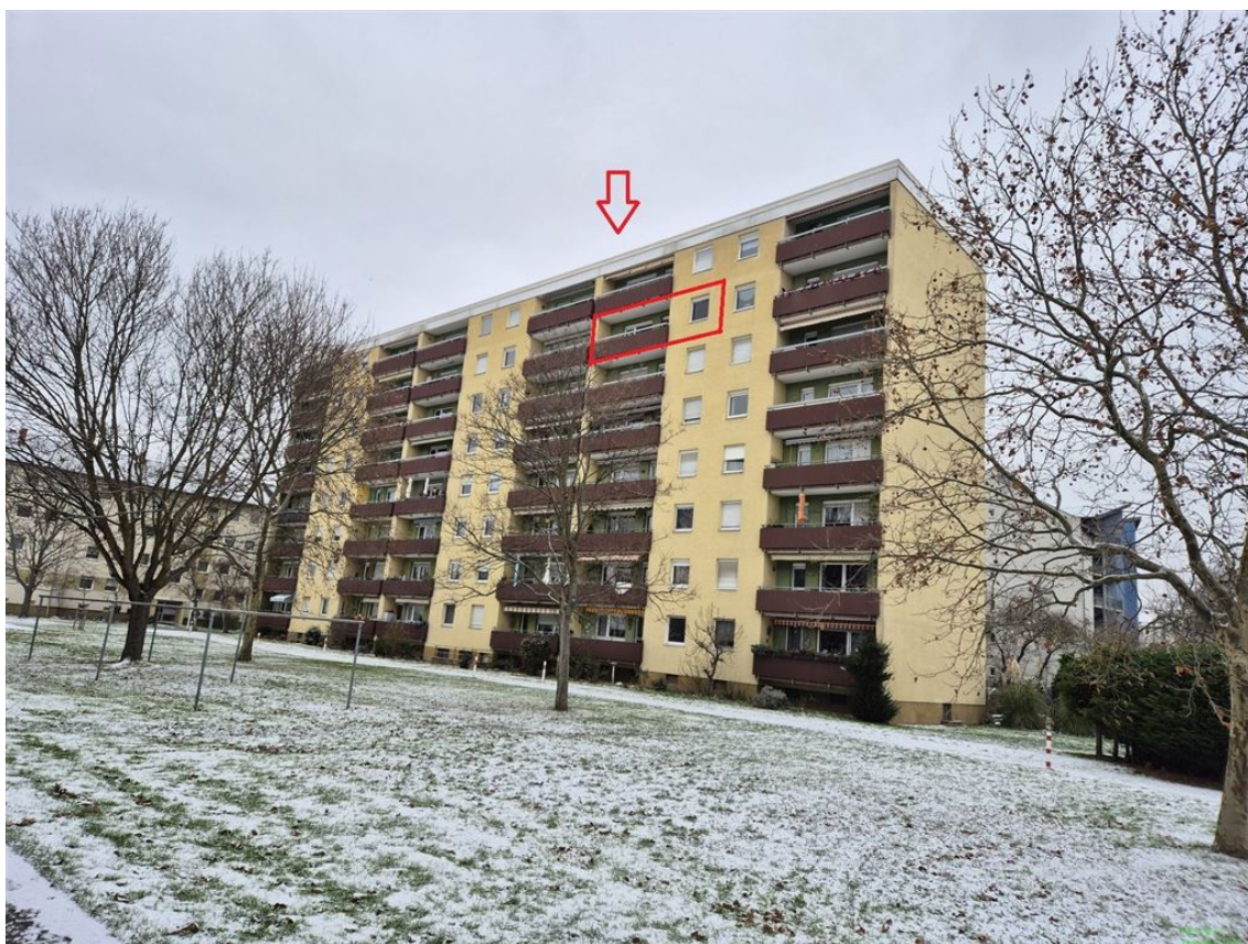
Dresdener Str. 26, 67098 Bad Dürkheim