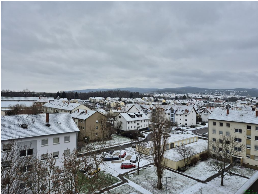
Blick nach Süd