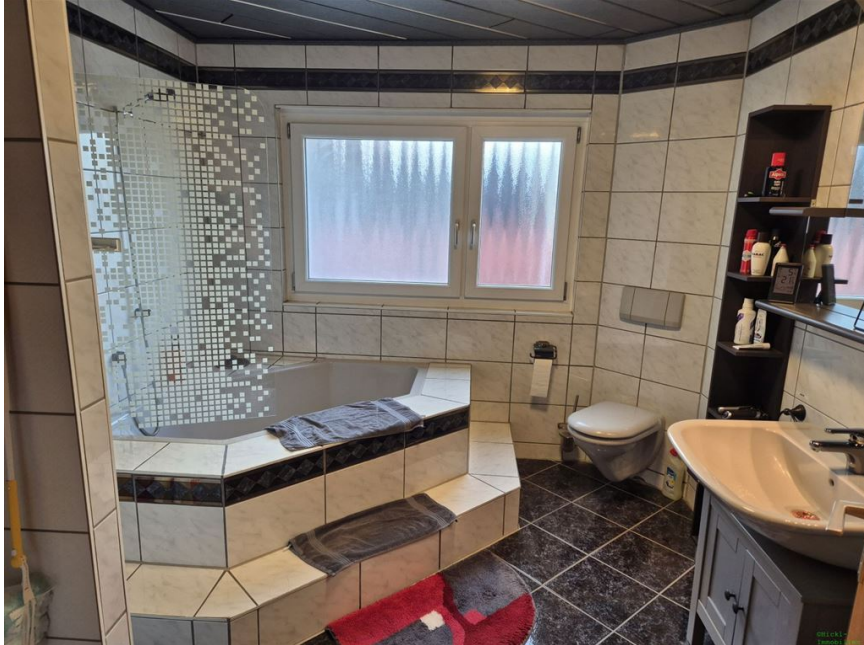
Bad OG 1