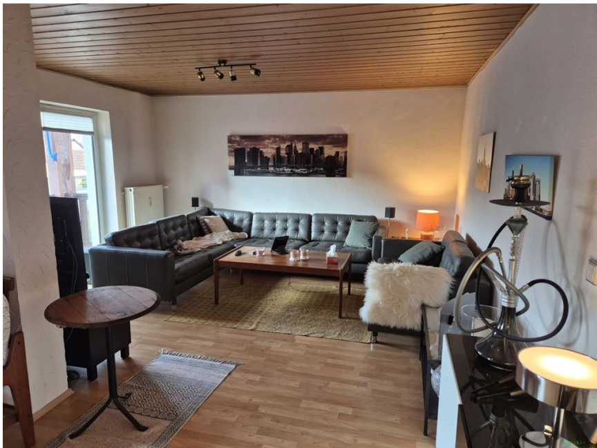
Wohnen OG 1