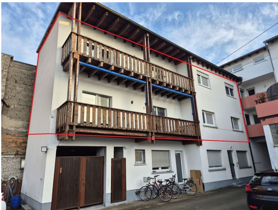
Hauptstr. 47, 67133 Maxdorf , Pfalz