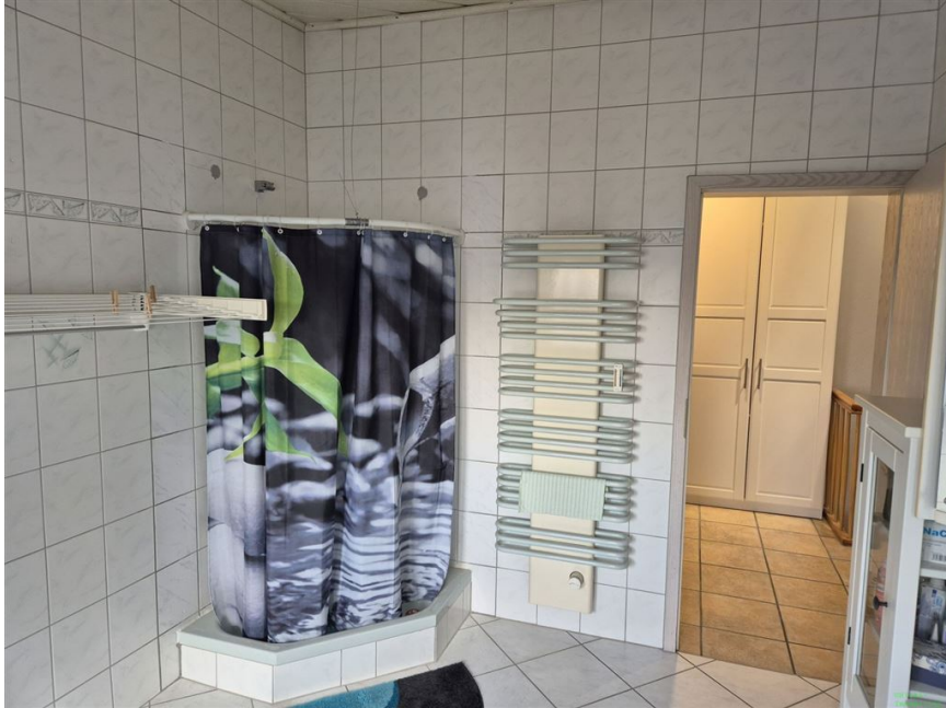
Bad OG 2