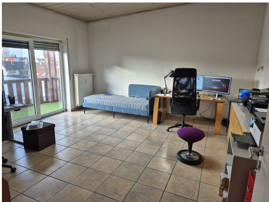
Schlafen OG 2