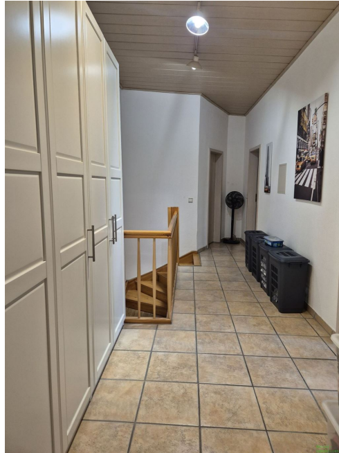
Flur OG 2