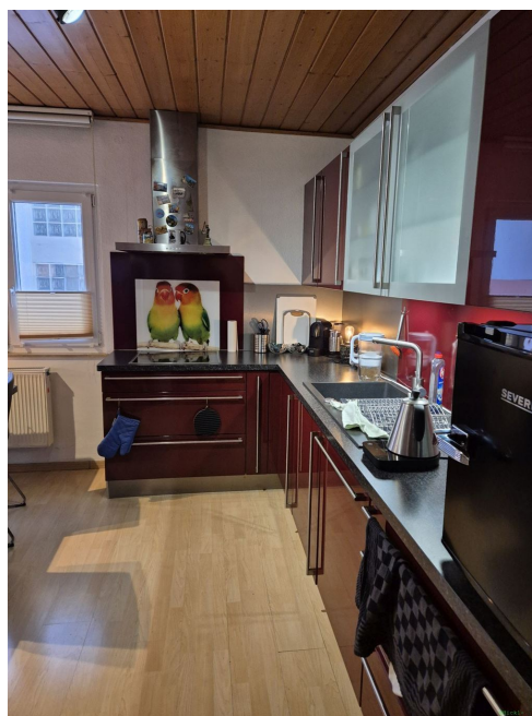
Küche OG 1