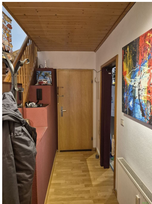
Eingang Flur OG 1