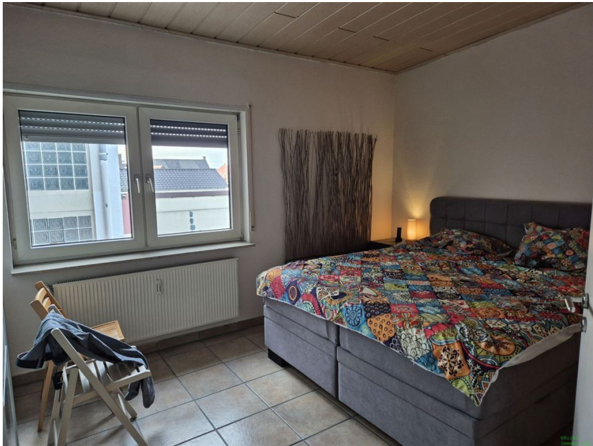
Kind I OG 2