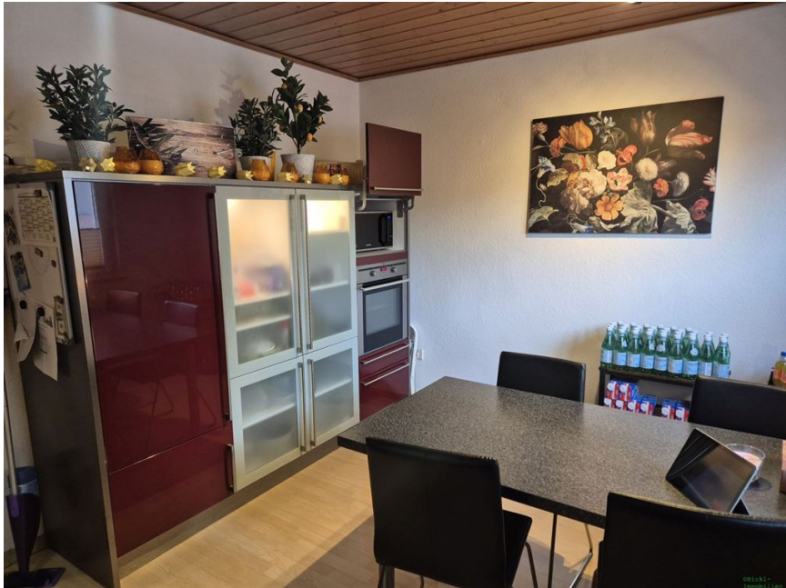
Küche OG 1