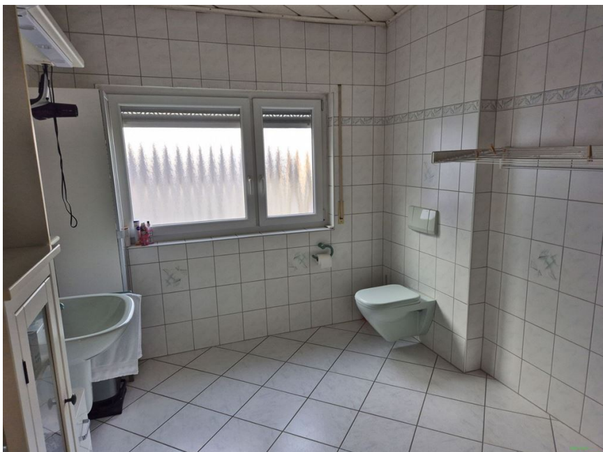
Bad OG 2