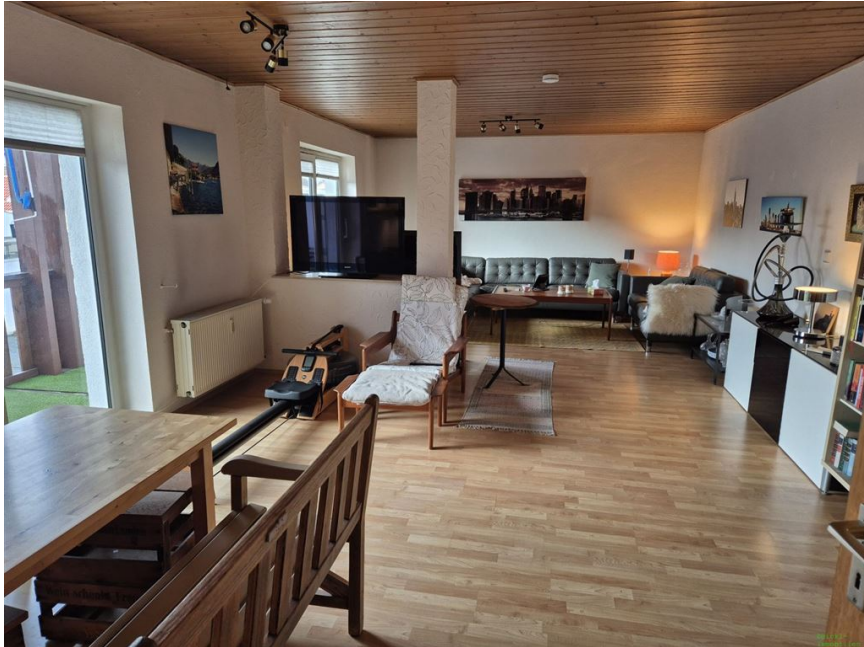
Wohnen Essen OG 1