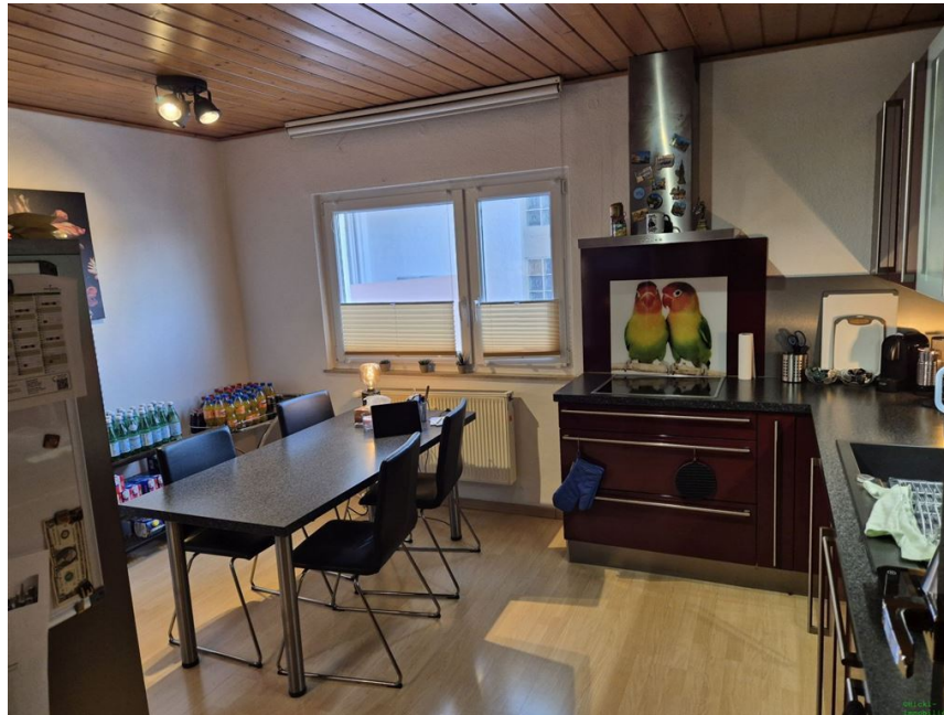
Küche OG 1