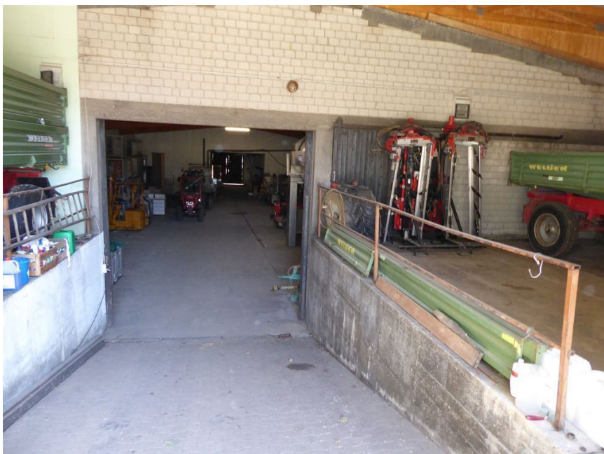
Zufahrt Halle hinten