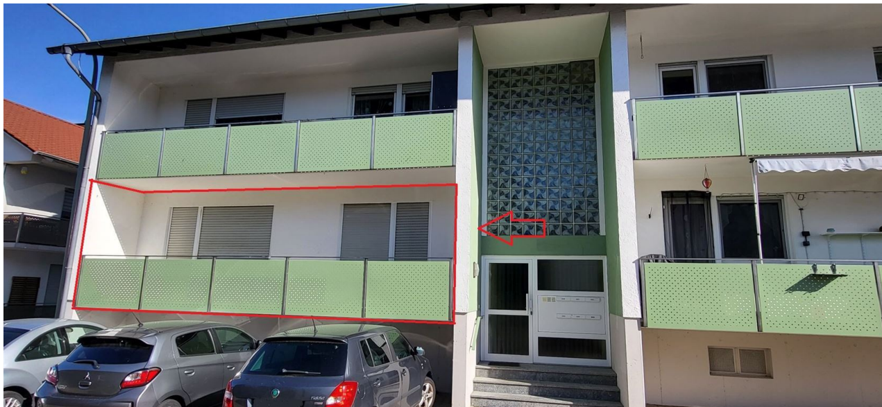
Dackenheimer Weg 11, 67273 Weisenheim am Berg